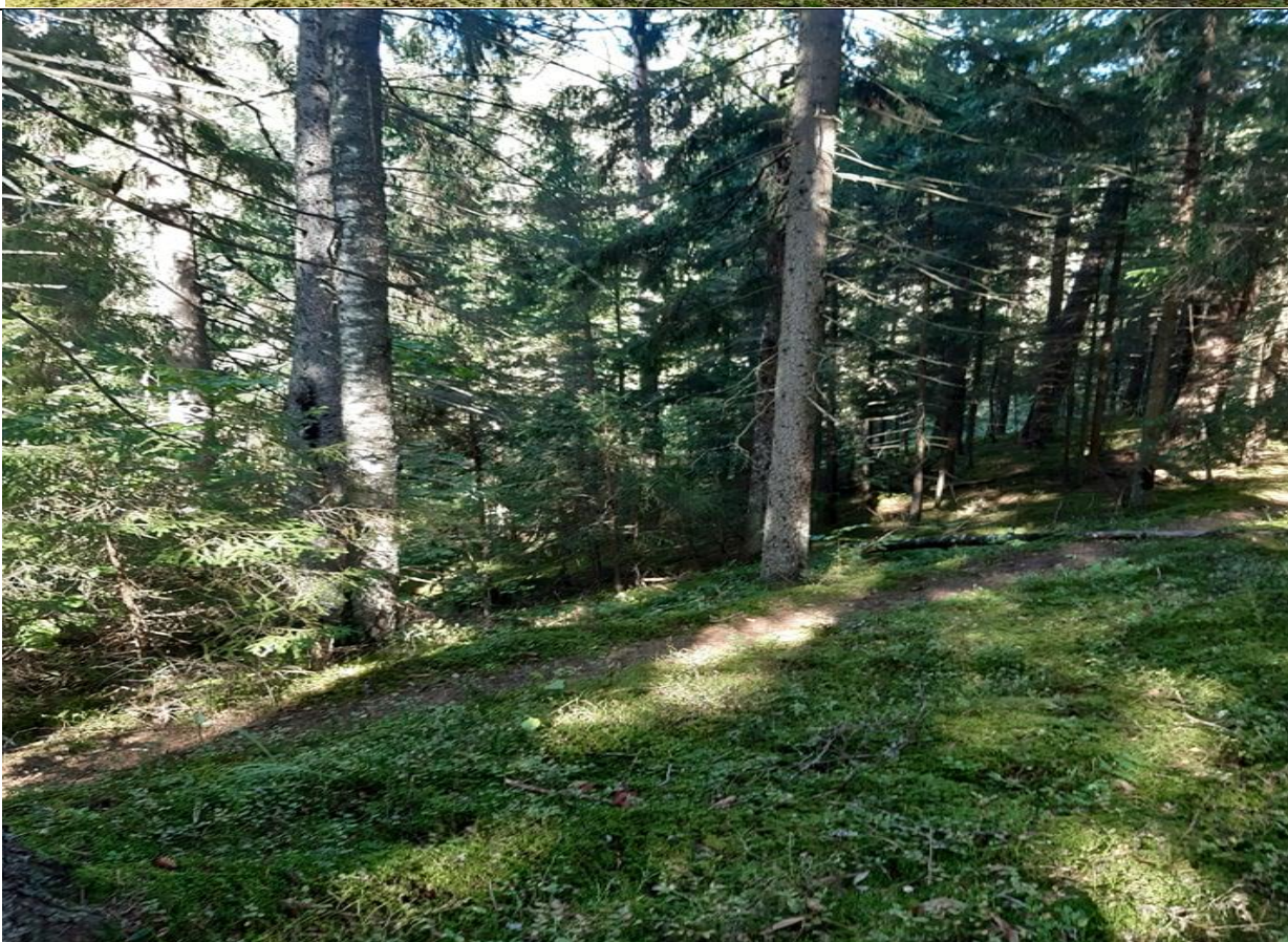
Kultūros vertybės kodas 13047