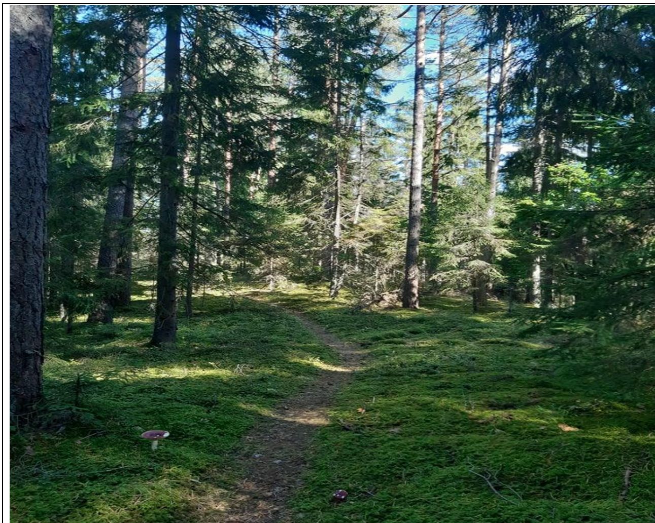
Kultūros vērtības kods 13047